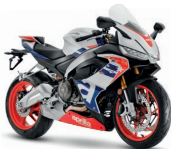
Stars & Stripes