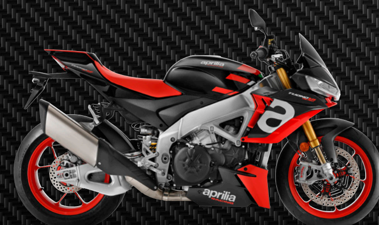
| SCHWARZ APRILIA