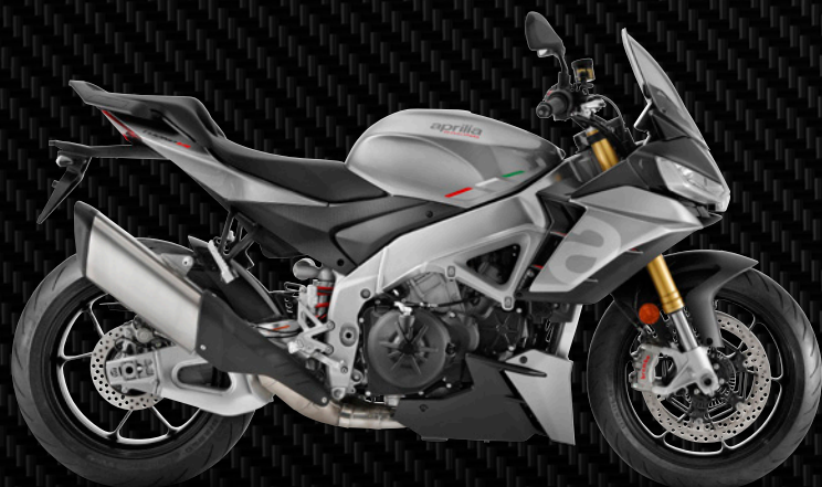
| GRAU TARMAC