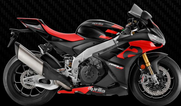
| SCHWARZ APRILIA