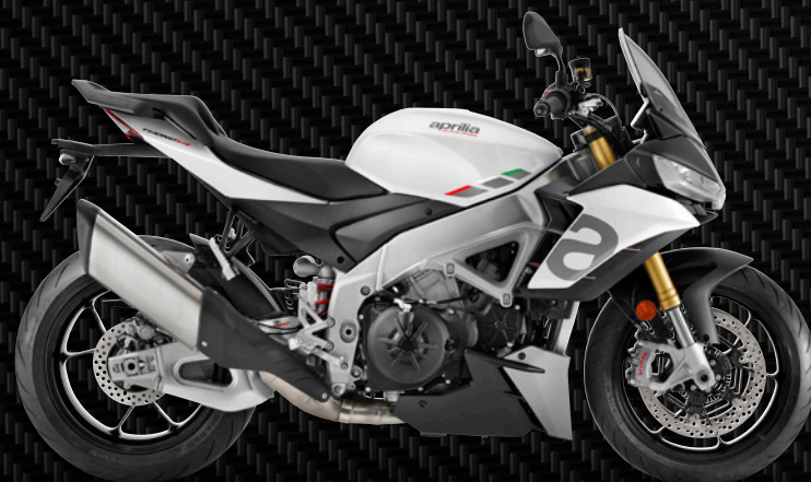
| WEISS GLACIER