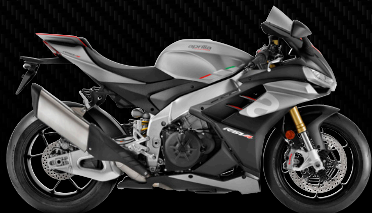
| DARK LOSAIL