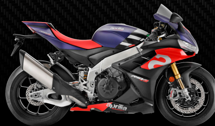
| ROT LAVA