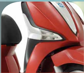
ROT IBIS 884/A