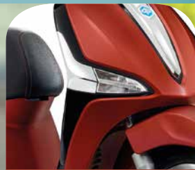
ROT MATT 888/A (Gilt nur für die 125cm 3 -Version.)