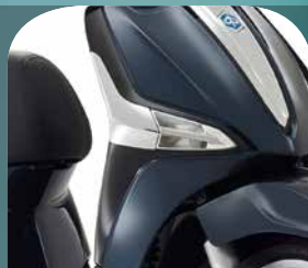
BLAU MIDNIGHT 222/A