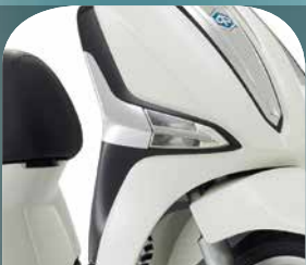
WEISS PERLA 566