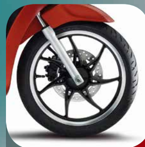
SCHWARZE LEICHTMETALLFELGEN MIT DIAMANT-CUT