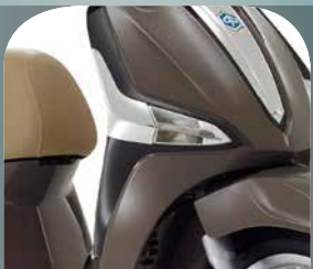
MARRONE MET 135/A