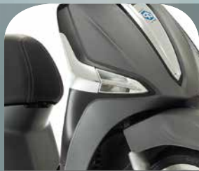
GRAU TITANIO 742/B